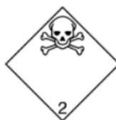
2.3 : Gases tóxicos

Etiquetado para el transporte Clase de riesgo