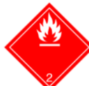
2.1 : Gases inflamables