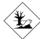
9E : Sustancias peligrosas para el medio ambiente